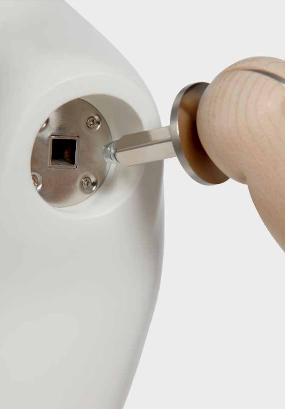
THE PUSH AND PULL FITTING THAT CONNECTS THE ARM TO THE MANNEQUIN SIMPLIFIES THE ASSEMBLY AND DRESSING OF THE MANNEQUIN.