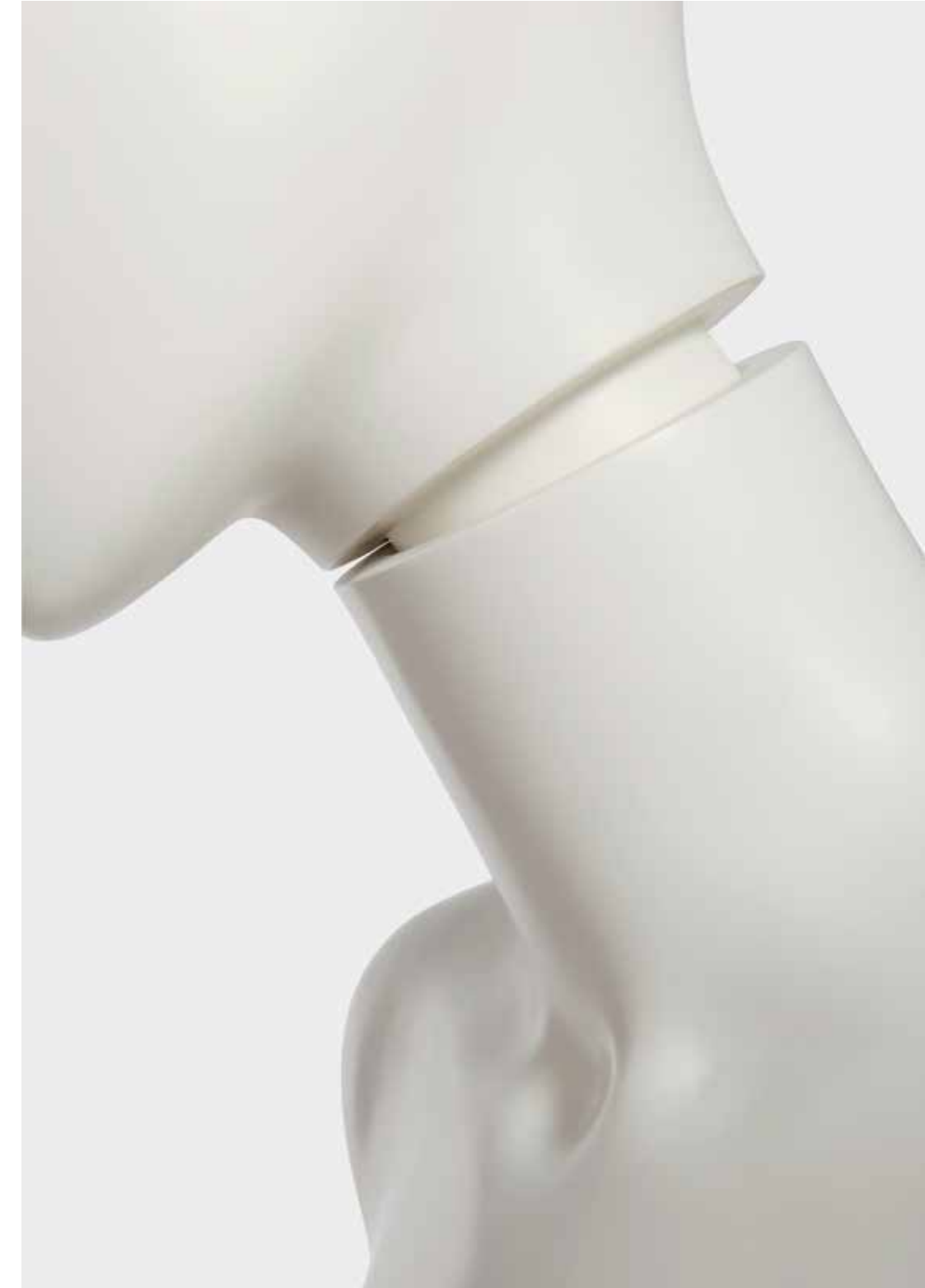
THE HEAD IS HELD ON BY MAGNETS IN THE NECK OF THE BUST.