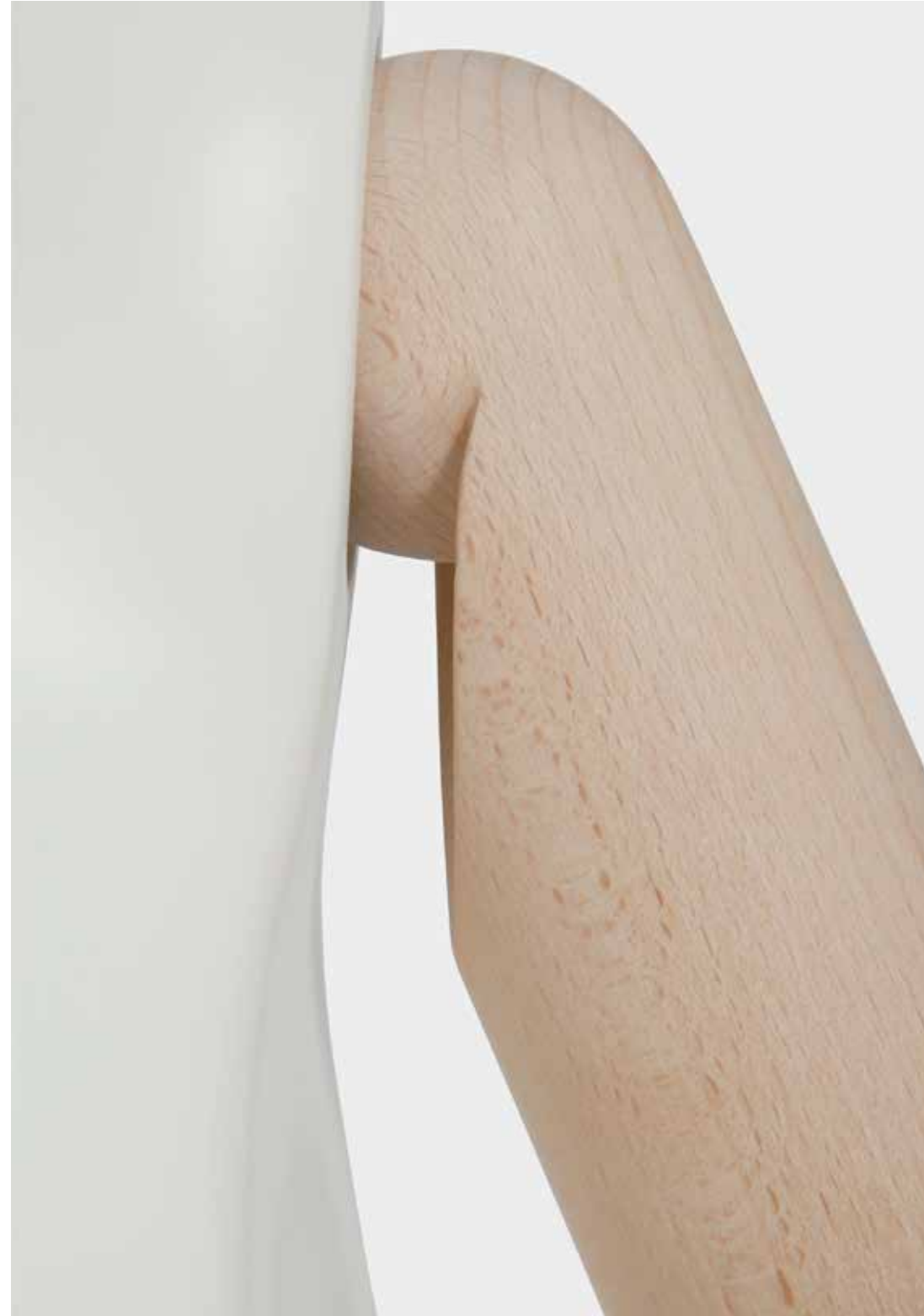
RECESSES IN THE TOP PART OF THE ARMS FACILITATES DRESSING EVEN WITH THICK CLOTHING