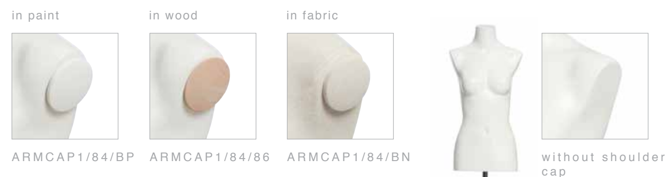
ARMCAP1/84/BP ARMCAP1/84/86 ARMCAP1/84/BN without shoulder cap

accessories for mannequins and all busts