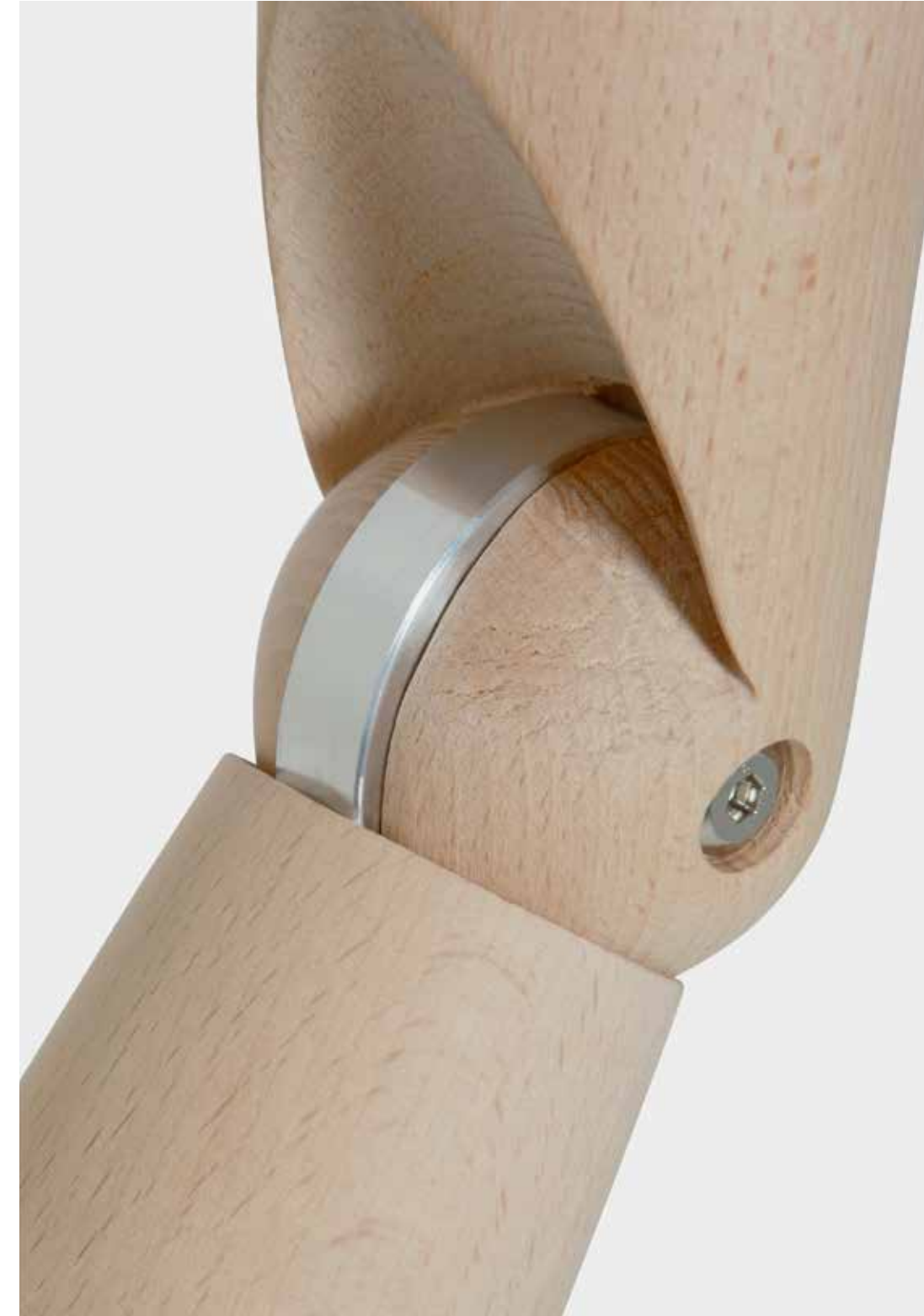
EACH MOVING PART CAN BE TIGHTENED TO KEEP THE REQUIRED POSITION AND LOOSENED TO FACILITATE THE POSITIONING OF THE ARMS.