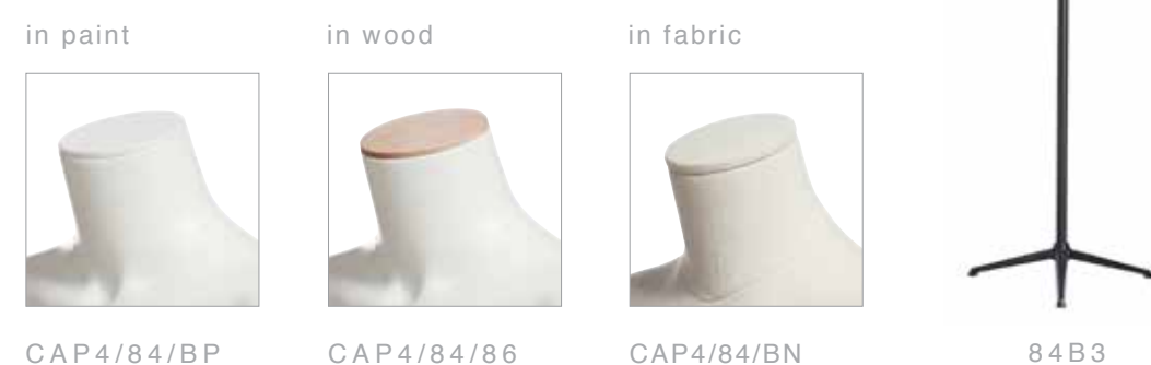
CAP4/84/BP CAP4/84/86 CAP4/84/BN 84B3

accessories for mannequins and all busts