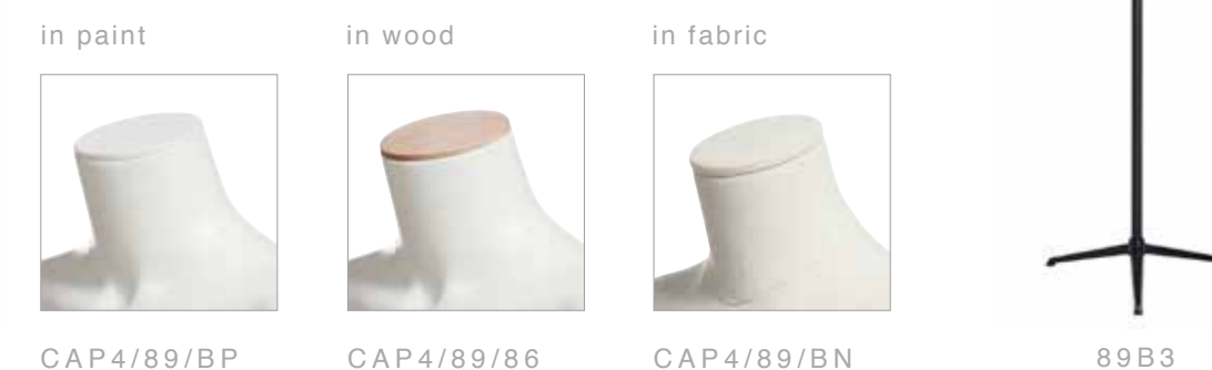
CAP4/89/BP CAP4/89/86 CAP4/89/BN 89B3

accessories for mannequins and all busts