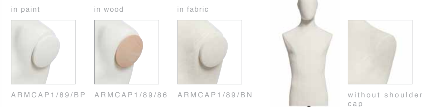
ARMCAP1/89/BP ARMCAP1/89/86 ARMCAP1/89/BN without shoulder cap

accessories for mannequins and all busts